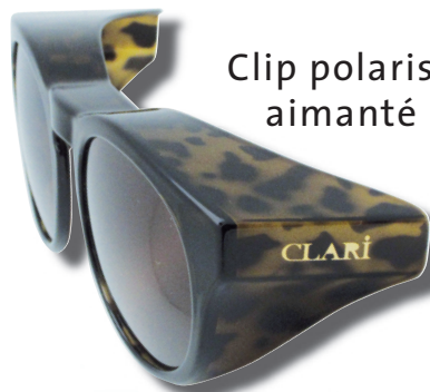
Clip polarisé aimanté